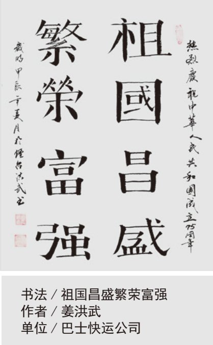
书法 / 祖国昌盛繁荣富强 作者 / 姜洪武 单位 / 巴士快运公司

成效。课程结束后，为进一步巩固课堂学习成果，组织开展了随堂知识测试。大家纷纷表示，此次培训收获颇丰，无论是对于内训师综合素养能力的提升，还是课程开发、授课技巧方面，都有着极大的助力。今后，会将所学内容充分运用到实际的授课过程中，将岗位经验加以提炼、业务知识加以梳理，整合开发优质课程，不断提高自身的授课能力与教学水平，努力成为企业文化与业务技能传承的引领者，为集团高质量发展贡献才智。